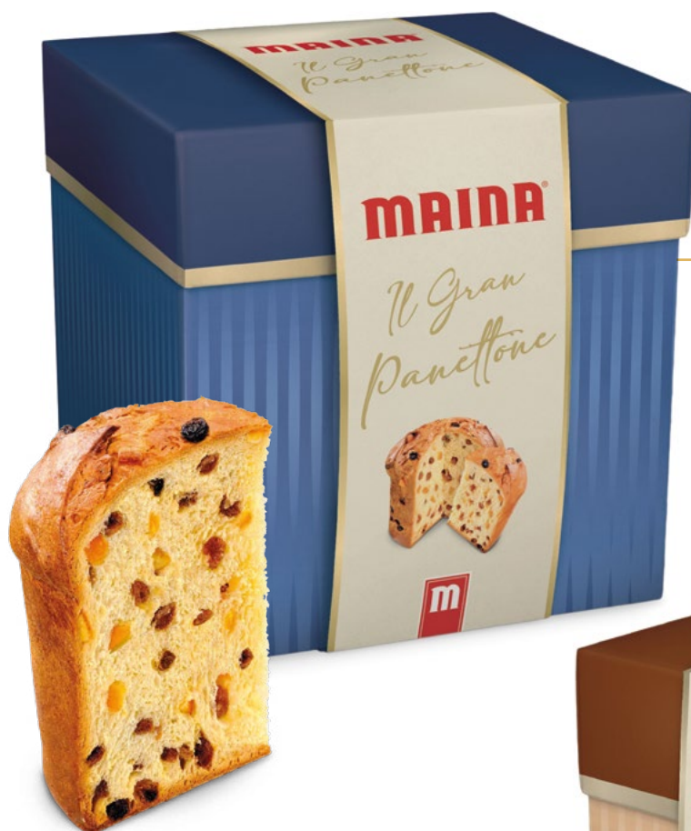
Panettone Linea Prestige Maina Kg.1