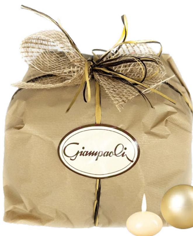
Panettone basso con uvetta, senza canditi incarto rustico Giampaoli gr.900